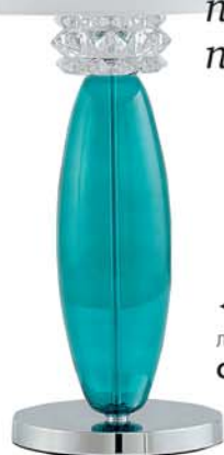
◀ Настольная лампа Vivien, CYAN

Когда на улице светит яркое солнце, мысли о пляже и море не покидают ни на минуту. Создать атмосферу побережья в доме можно с помощью предметов песочно-голубых тонов