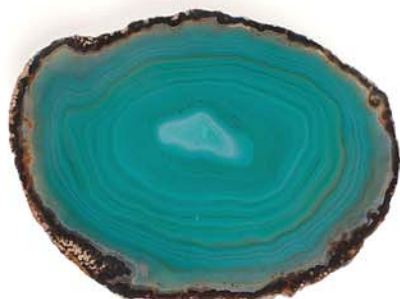
▲ Подставка Ita, RABLABS