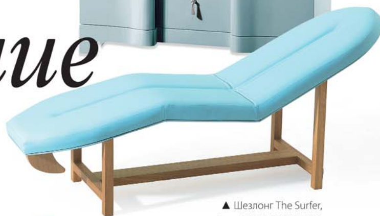
▲ Шезлонг The Surfer, дизайнер KHALID SHAFAR