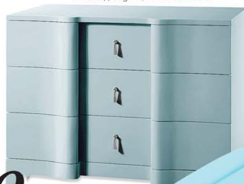
▼ Комод Brigitte, BUNGALOW 5