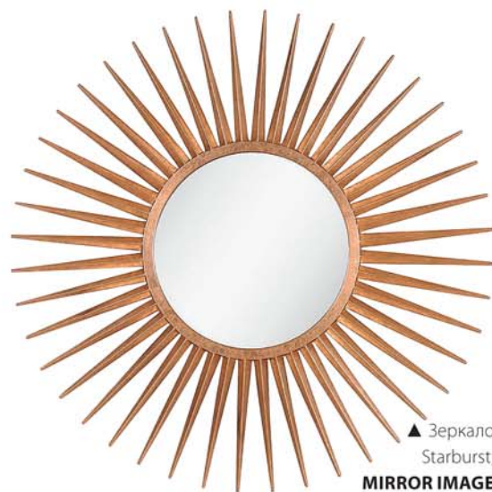
▲ Зеркало Starburst, MIRROR IMAGE