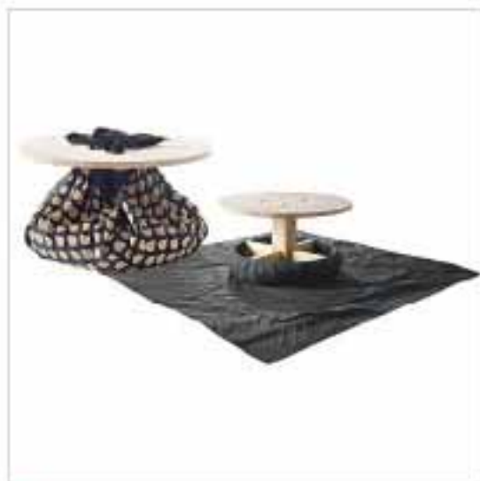
Q The Auction Khalid 小時候曾見人拿着黑布袋兜售貨物，於是取其原型設計成咖啡枱，黑布收起時是裝飾，攤開時是坐墊。