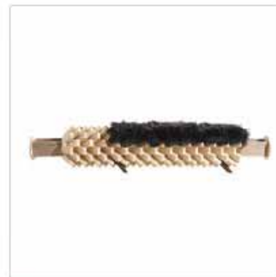
Q Fallen Palm 長枱設計靈感來自枯死的棕櫚樹，坐墊Cushion使用當地羊毛製造，兩邊設有小抽屜。