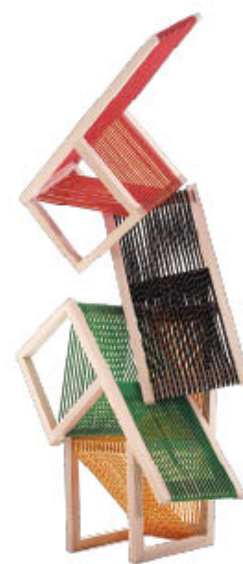
Illusion Dine 餐椅由鮮艷的聚酯纖維繩索組成，代表公路上出現的車籠。