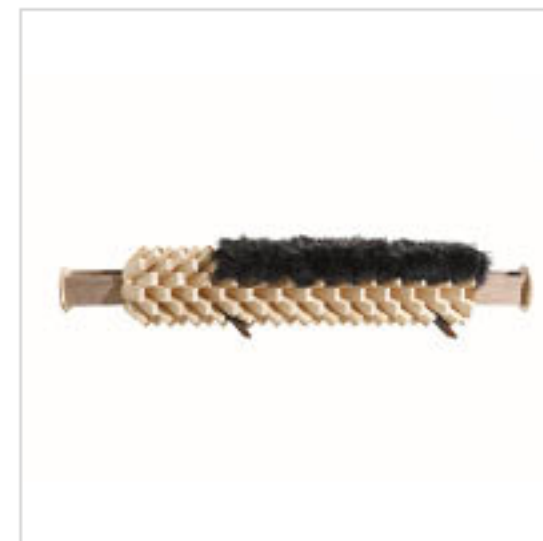
Q Fallen Palm 長枱設計靈感來自枯死的棕櫚樹，坐墊Cushion使用當地羊毛製造，兩邊設有小抽屜。