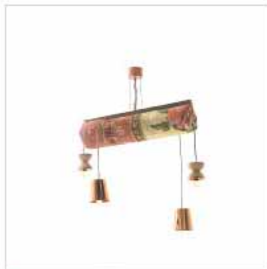
Q T 名為「Talli」的阿拉伯女性服飾，屬於一種用金銀色線交織而成的刺繡，設計師巧妙地把它結合成吊燈的一部分。