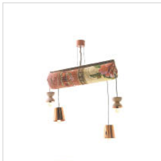
Q T 名為「Talli」的阿拉伯女性服飾，屬於一種用金銀色線交織而成的刺繡，設計師巧妙地把它結合成吊燈的一部分。