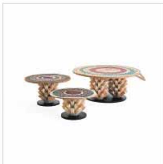
Q The Palm 咖啡枱的設計參考了棕櫚樹的樹幹外形和結構，枱面的墊子「Sarood」是用棕櫚樹葉編織而成。